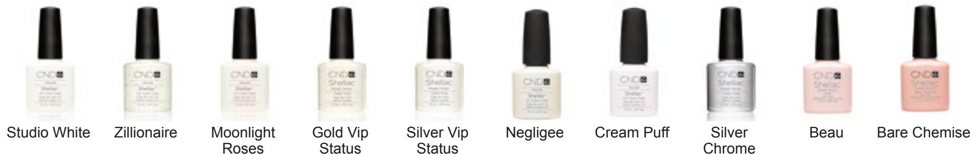
Studio White Zillionaire Moonlight Roses Gold Vip Status Silver Vip Status Negligeé Cream Puff Silver Chrome Beau Bare Chemise