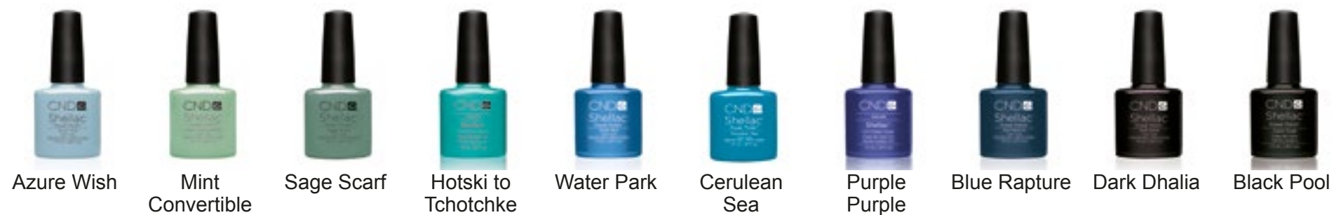
Azure Wish Mint Convertible Sage Scarf Hotski to Tchotchke Water Park Cerulean Sea Purple Purple Blue Rapture Dark Dahlia Black Pool