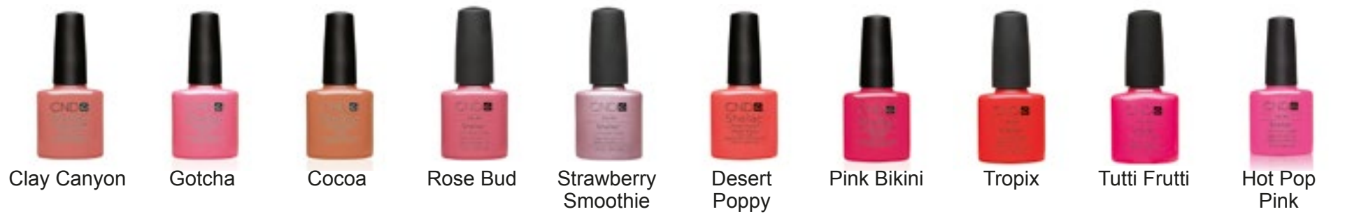
Clay Canyon Gotcha Cocoa Rose Bud Strawberry Smoothie Desert Poppy Pink Bikini Tropix Tutti Frutti Hot Pop Pink