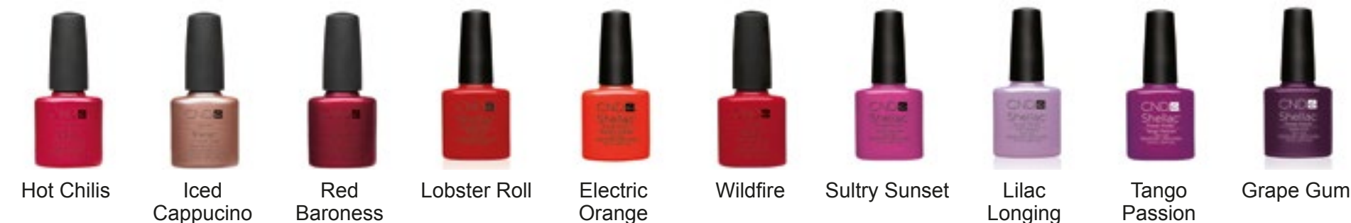
Hot Chilis Iced Cappuccino Red Baroness Lobster Roll Electric Orange Wildfire Sultry Sunset Lilac Longing Tango Passion Grape Gum