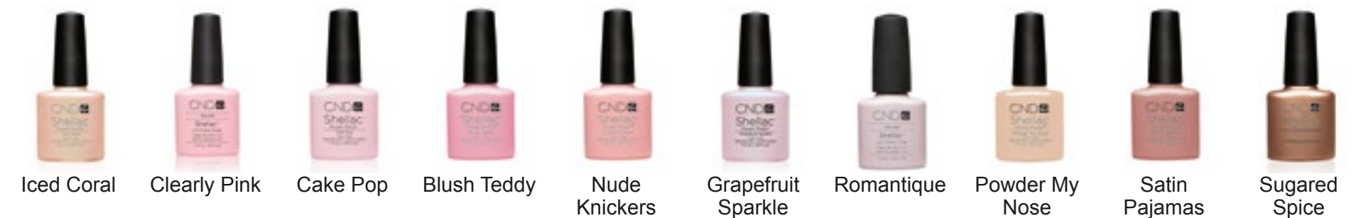
Iced Coral Clearly Pink Cake Pop Blush Teddy Nude Knickers Grapefruit Sparkle Romantique Powder My Nose Satin Pajamas Sugared Spice