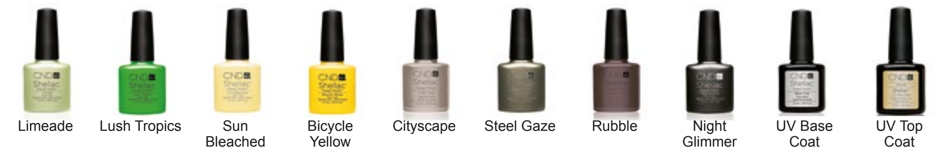
Limeade Lush Tropics Sun Bleached Bicycle Yellow Cityscape Steel Gaze Rubble Night Glimmer UV Base Coat UV Top Coat