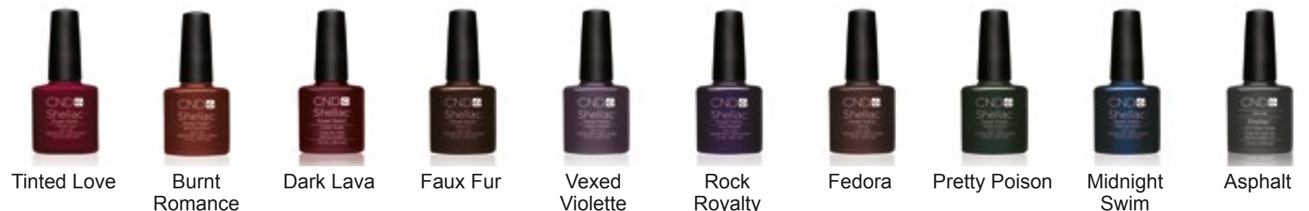
Tinted Love Burnt Romance Dark Lava Faux Fur Vexed Violette Rock Royalty Fedora Pretty Poison Midnight Swim Asphalt